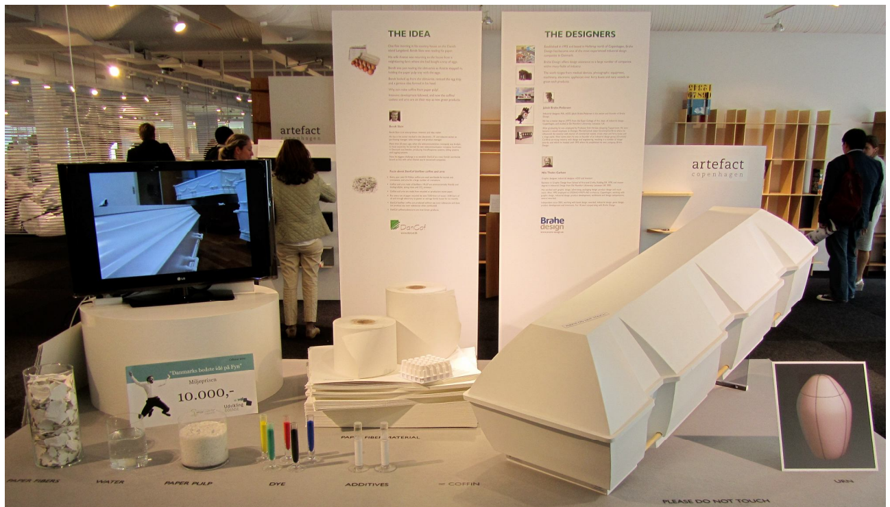
Her ses standen på CODE11